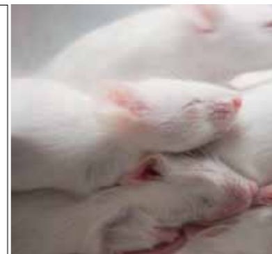
Homöoprophylaxe – Gisela Immich