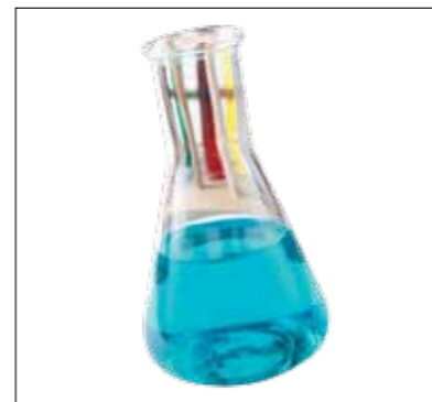
Carboneum sulphuratum – Roger Morrison