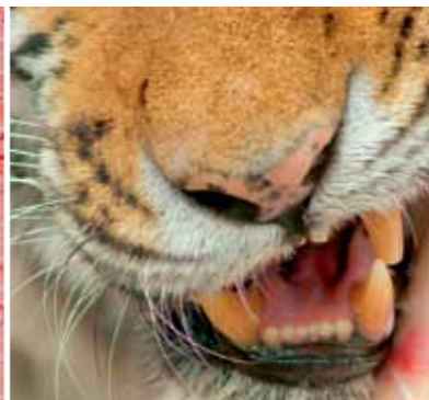
Migräne – Irmela Göckenjan-Storz