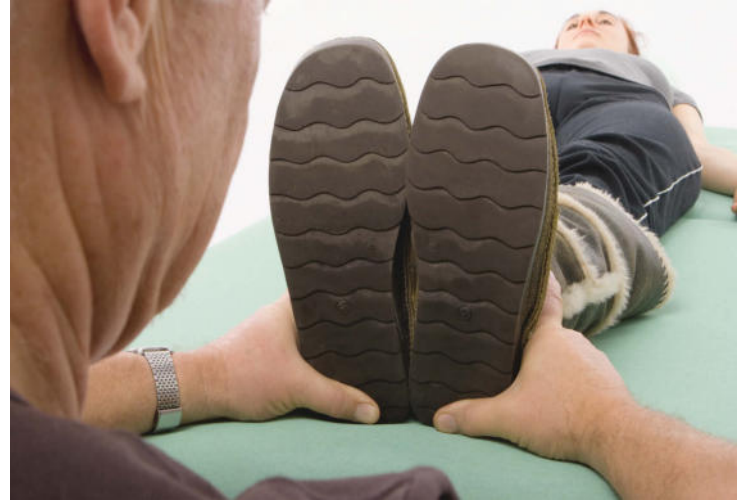
Der Therapeut legt die Daumen seiner Hände links und rechts im Bereich der Schuhsohle mittig möglichst nahe am Fersenrand auf.