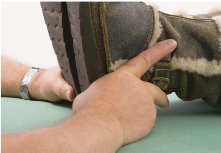
Die Außenknöchel der Füße liegen zwischen Zeige- und Mittelfinger. Die Finger nehmen dabei die Haltung wie bei einer Schwurhand ein.