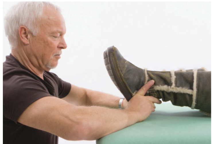
Jetzt drückt der Therapeut beide Fersen des Patienten nach hinten weg, wodurch sich die Schuhspitzen auf den Therapeuten zu bewegen. Damit werden die oberen Sprunggelenke fixiert, so dass sie keinen Bewegungsspielraum mehr haben.