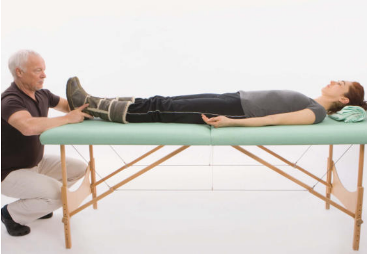
Ausgangsposition wie in Kapitel 1.1.